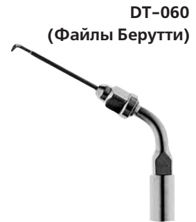
DT-060 (Файлы Берутти)