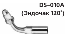
DS-010A (Эндочак 120°)